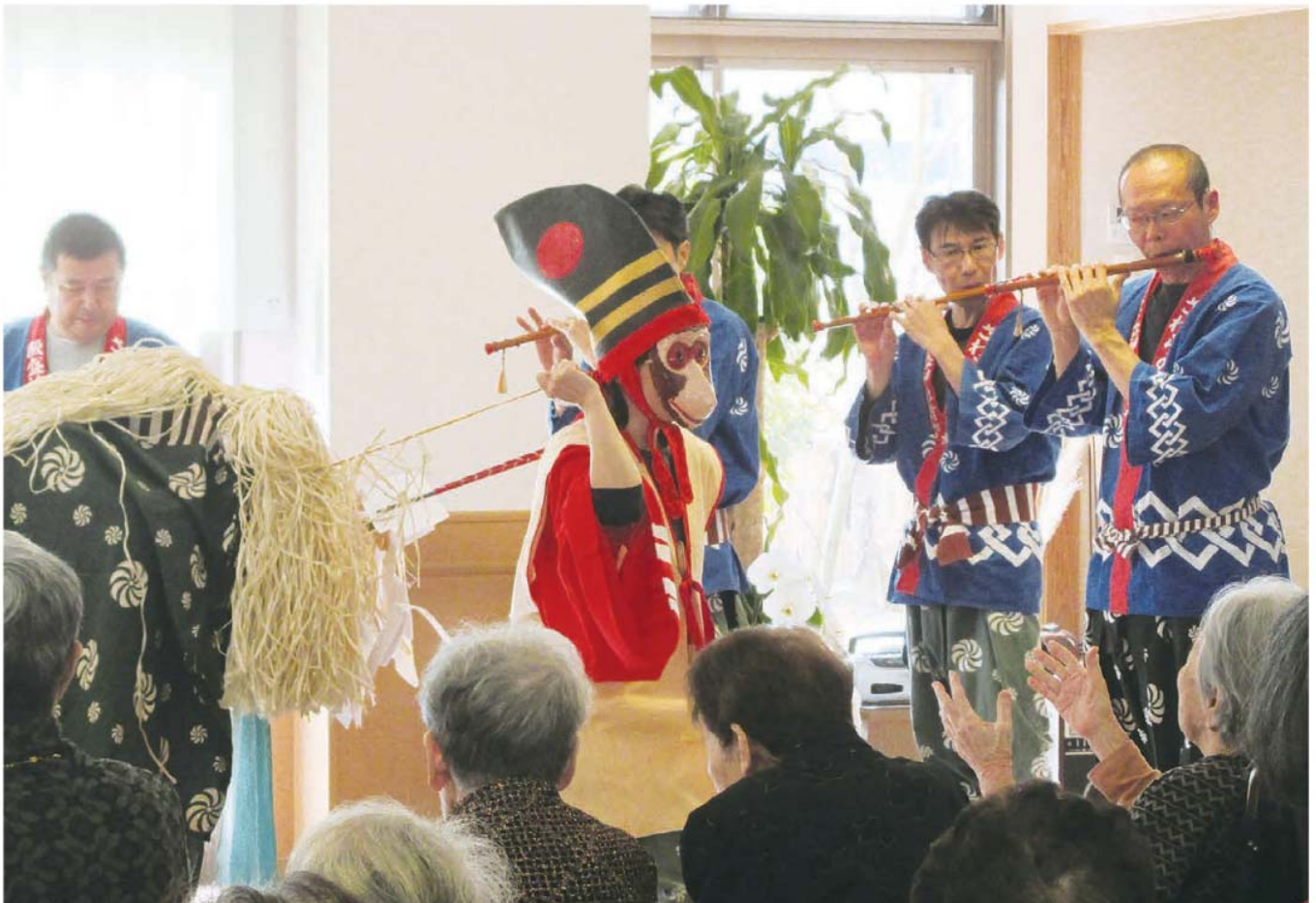
獅子舞・御猿の舞(サ高住「かりん」)

診療科目 消化器・肝臓内科、血液・腫瘍内科、神経内科、循環器内科、呼吸器内科、糖尿病・内分泌内科、腎臓内科、緩和ケア内科、眼科、整形外科、内科、外科、リハビリテーション科、老年内科、人工透析内科