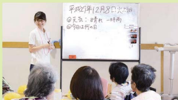
「今日は何の日?!」とクイズ方式で問いかけをしています。

院内デイケアに参加することで、日常生活や認知機能の維持、向上を図ることができると考えています。1日でも早く回復に向かわれますように、病院全職員が関わり、支援させていただいています。参加された患者さんの笑顔や、生き生きとした表情が私たちのやり甲斐です。是非一度、見学にお越し下さい。家族同伴も大歓迎です。