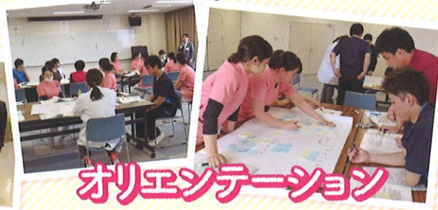
オリエンテーション