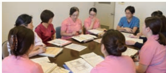
転倒転落防止委員会会議風景