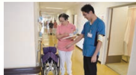
転倒転落防止ラウンド

メンバー： 委員長、各部署(16部署)スタッフ 計17名 活動内容： 指差し呼称実施指導 KYT(危険予知トレーニング)を年1回実施 部署内0レベル報告の推進