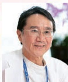
村上華林堂病院 病院長

2020年は、東京オリンピックが開催され、日本国民全体が一丸となる貴重な年であります。村上華林堂病院もスタッフ一丸となり、これまでと同様に地域医療のために貢献していきたいと思っております。本年もよろしくお願い申し上げます。