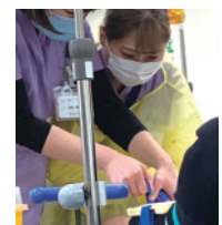
点滴トレーニング