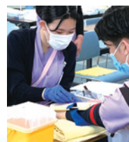
採血トレーニング