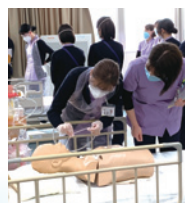
喀痰吸引トレーニング