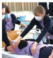
体位変換トレーニング

これから1年間のプログラムで知識と技術を身に着け、少しずつ、一步一步、 信頼される素敵なナースに成長できるよう頑張ってもらいます。