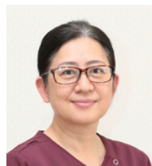
サービス付き 高齢者向け住宅かりん 施設長

これからも病院併設施設として、介護だけではなく看護、医療の提供も丁寧に行いながら終の棲家としての役割を果たし、自分の身内を安心して任せられる施設、またスタッフもやりがい甲斐を感じて働く事ができる施設であることを目指し続けていきます。