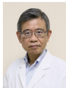
村上華林堂病院 病院長

当院は内科、眼科、整形外科の診療を行っていますが、内科は総合診療科として身体全体を診て、必要に応じて各専門領域の内科医が担当いたします。特色としては、パーキンソン病や筋萎縮性側索硬化症などの神経難病診療、通院が困難な方への在宅診療、癌末期の終末期に対処する緩和ケア、充実したリハビリテーションの提供体制があります。たとえ病気を治すことができなくても、癒しが得られるように寄り添ってまいります。