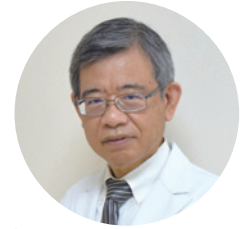
院長・ 脳神経センター長