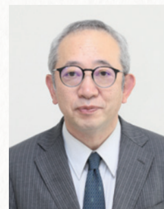
医療法人財団 華林会 理事長

新型コロナウイルスウイルスは未だ変異を繰り返しながら周期的に広がってはおりますが、世の中は次のステップに向かって動き始めています。当院も翻弄されることなく様々な課題に取り組みながら、地域医療のために尽力させていただければと思います。