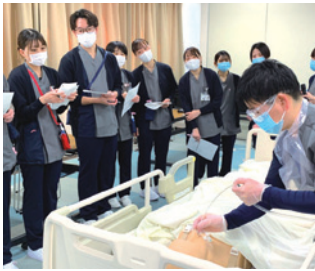
吸引トレーニング