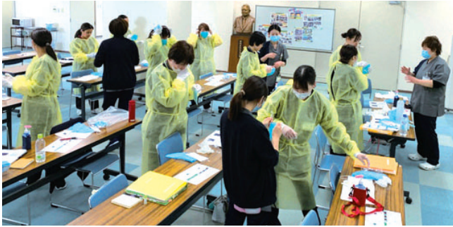
ガウンテックトレーニング

4月2日から4日間、新人看護職員研修も開催され、医療機器の取り扱いや採血・喀痰吸引等の看護技術や感染、安全対策等を学びました。各現場での活躍を願ひます。