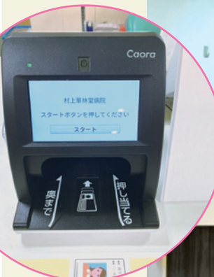
顔認証付き カードリーダー