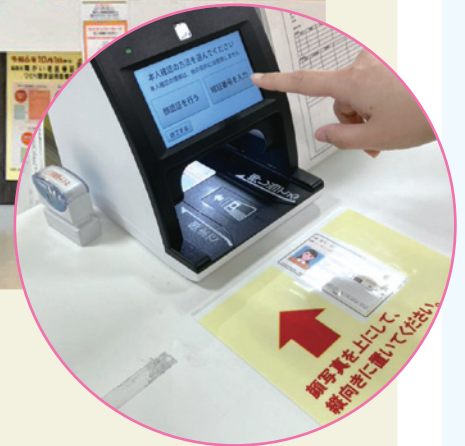
顔認証付きカードリーダー