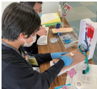
採血トレーニング