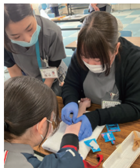
採血トレーニング

新採用者オリエンテーションの翌日から、新人看護職員研修(講義・技術)を3日間実施しました。この研修では看護部だけではなく、理学療法士や臨床工学技士、介護福祉士も一緒に学びました。みんな初々しく表情も生き生きとしています。これから1年間のプログラムで知識と技術を身につけ、少しずつ、一步一步、信頼される素敵なナースに成長できるよう支援していきます。