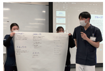
グループワーク発表