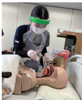
喀痰吸引トレーニング