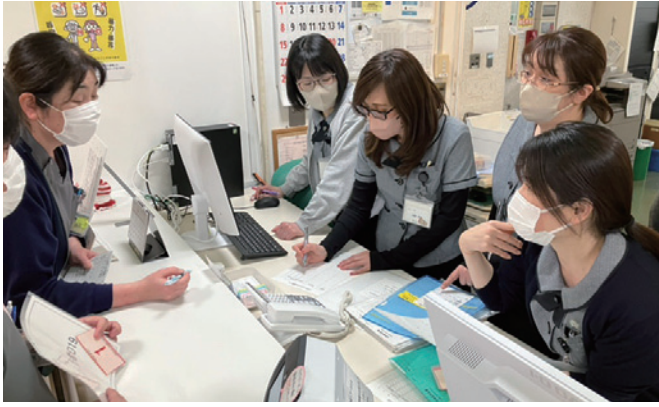
システム障害訓練

3月26日にシステム障害訓練を行いました。今回の訓練は、「電子カルテシステムが使用できなくなったときでも、「患者情報を正しく収集できること」「紙カルテや帳票に記録できること」「多職種間でスムーズに連携できること」が目的です。病院の電子カルテシステムが停止してしまうと、検査や会計など様々なところで患者さんに影響が発生してしまいます。当院では、そのような状況において、できる限り診療への影響を最小限にするようシステムが突然停止したことを想定した訓練を行っております。