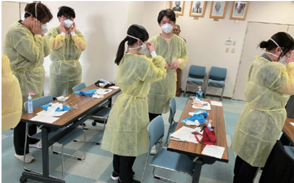
ガウンテクニックトレーニング