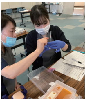
注射トレーニング