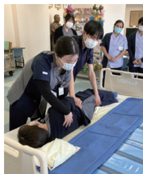
体位変換トレーニング