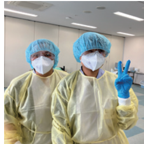
ガウンテクニックトレーニング